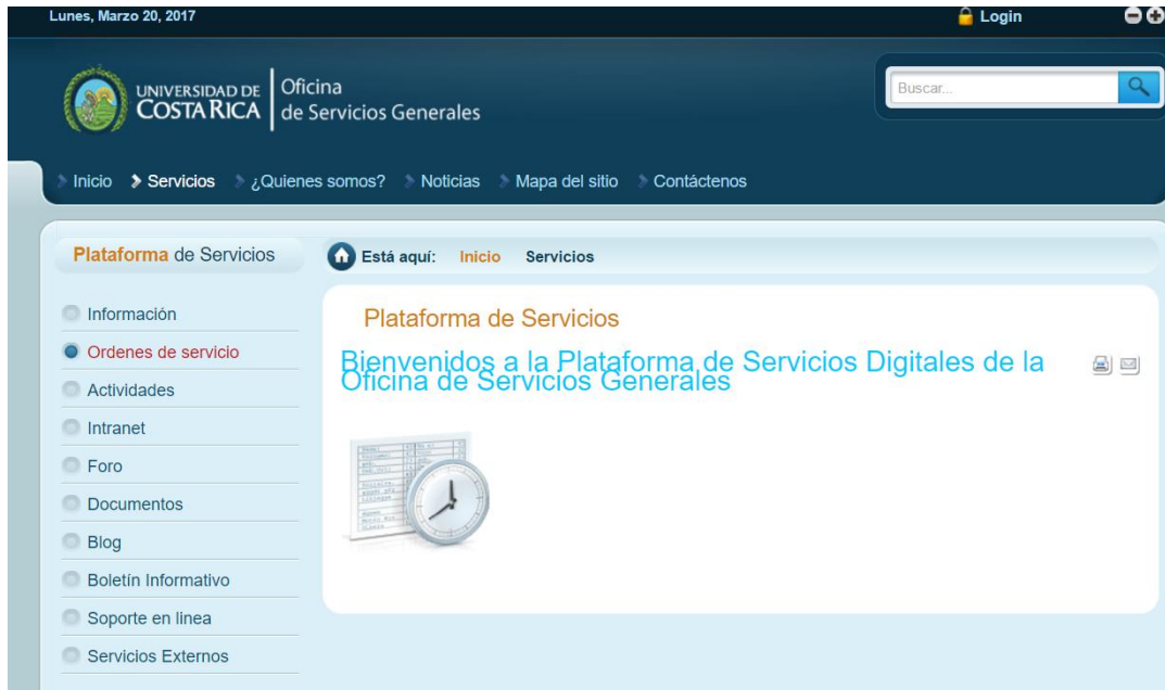
Figura 1: Menú de la página de órdenes y servicio