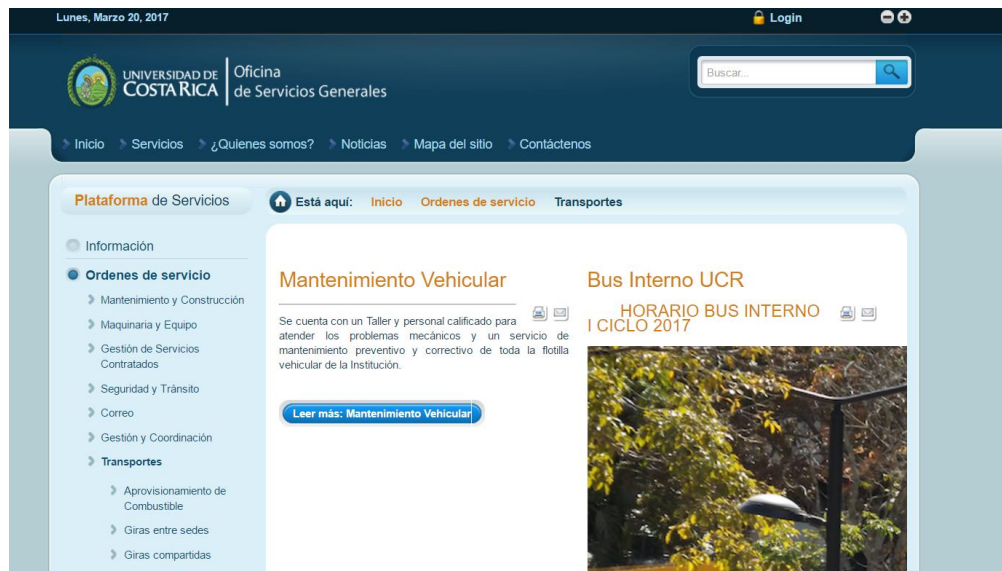
Figura 2: Menú de la página de órdenes y servicio

4) El sistema muestra un calendario con los servicios entre sedes planificados para el mes