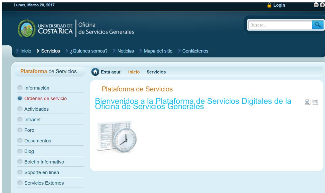
Figura 2: Menú de la página de órdenes y servicio