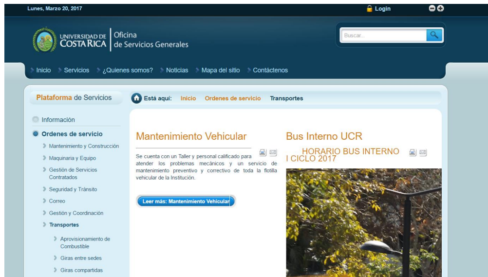
Figura 2: Menú de la página de órdenes y servicio